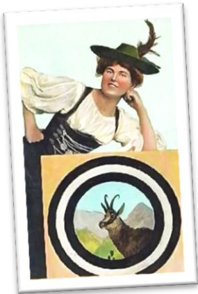
Unbekannt, 20. Jh.