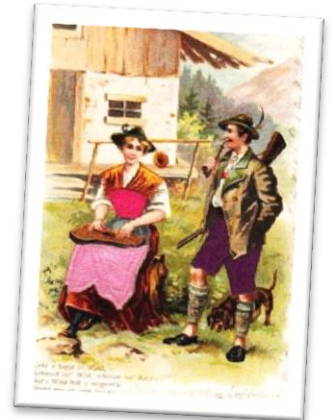
Unbekannt, 20. Jh.