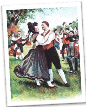
Unbekannt, 19. Jh.

Und bist du mir dann wie einstmals im Mai, so bleib ich bei dir auf ewige Treu.