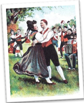
Unbekannt, 19. Jh.

Worte und Weise: Aus Schlesien und Mähren, 19. Jh.