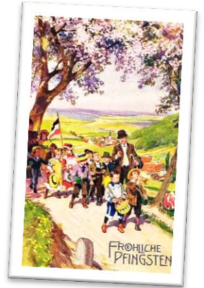
Unbekannt, 19. Jh.